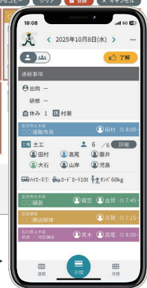
番割りスマホ受信画面（日程画面）▶